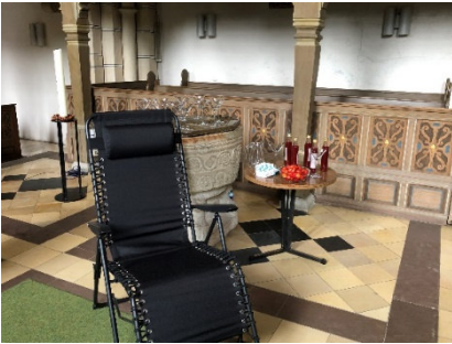
Und Gott ruhte am siebten Tag – Schöpfung im Konfirmanden- unterricht