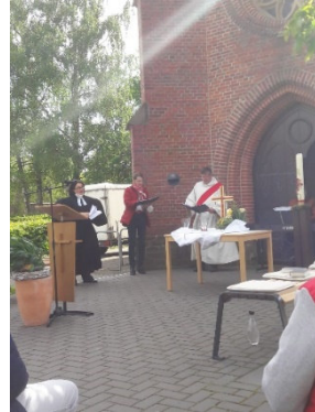
Der Wind wehte – Pfingstmontag vor St. Marien