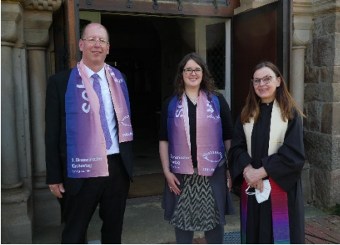
Himmelfahrtsgottesdienst – Besuch aus Wulfenau